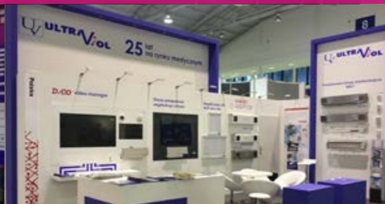
SALMED 2018 - MTP POZNAŃ