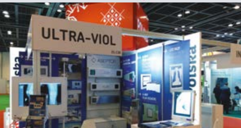
ARAB HEALTH 2019 - DUBAJ

PNAD 25 LAT DOŚWIADCZENIA W DEZYNFEKCYJ PROMIENIOWANIEM UV-C