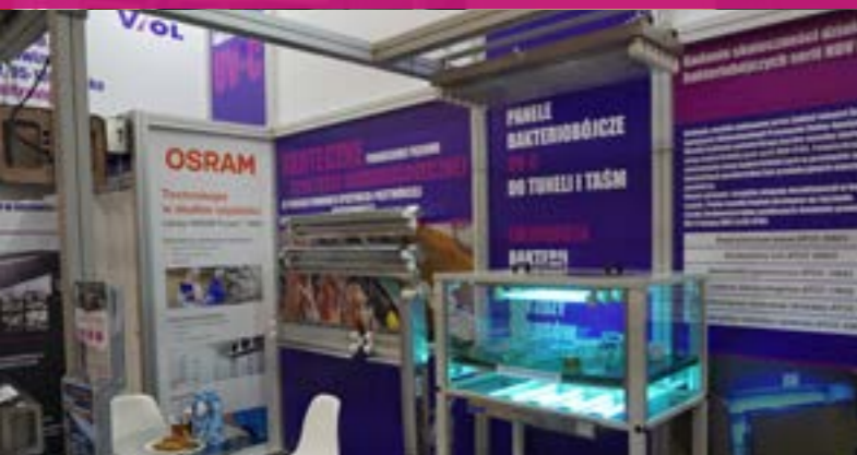
POLAGRA 2019 - MTP POZNAŃ