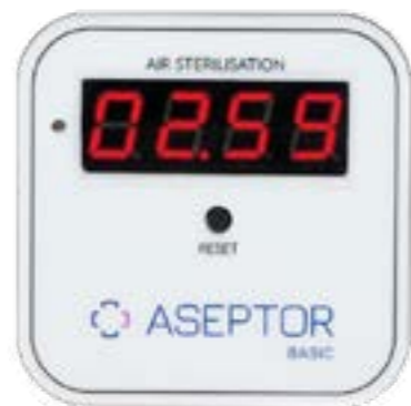
C - zaawansowany licznik czasu pracy w ASEPTOR Basic