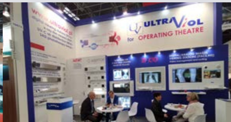
MEDICA 2019 - MESSE DÜSSELDORF