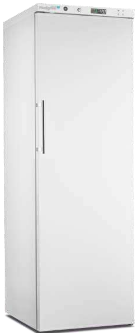
MPRA 450 S