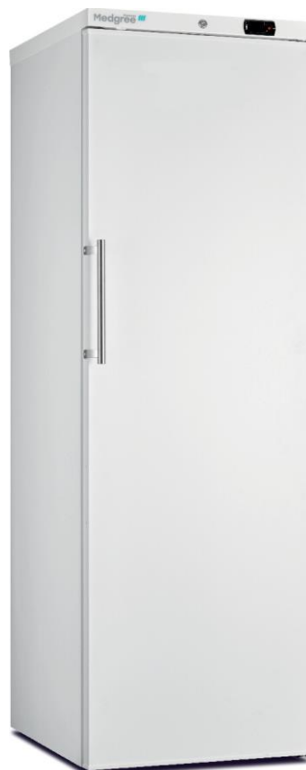
MLF 450 S