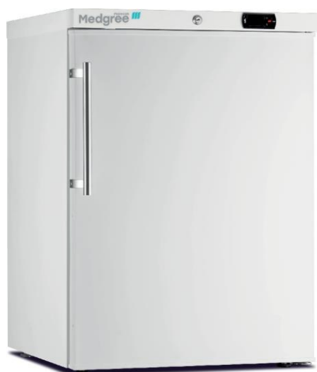
MLF 150 S