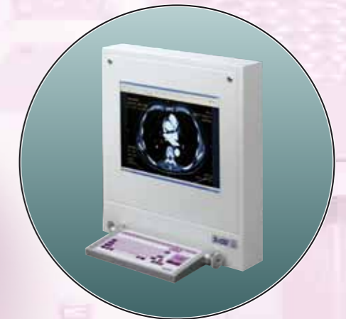
Wersja na statywie jezdnym