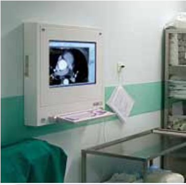
DiCO 1M (30")