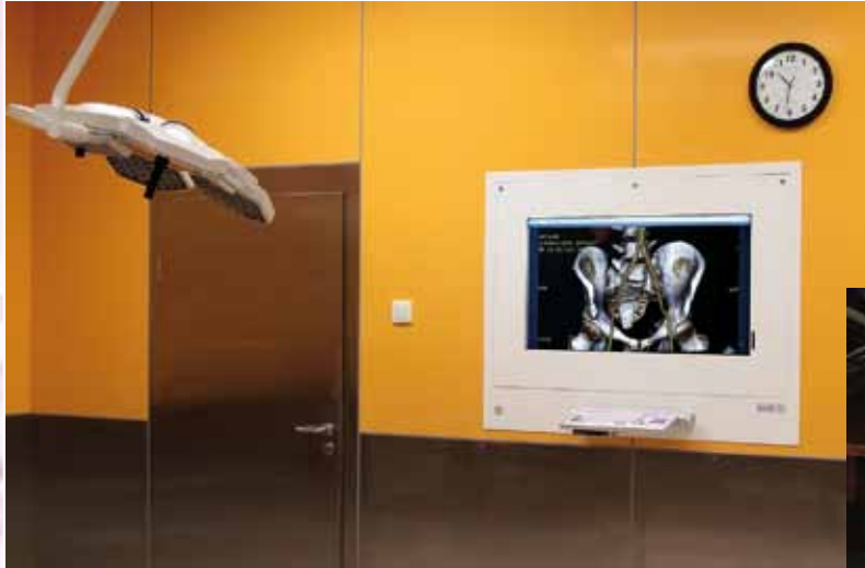
DiCO 1M (40")