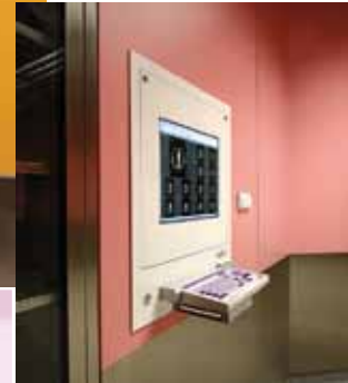
DiCO 1M (21")