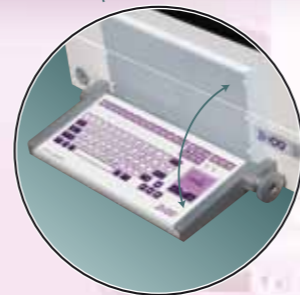
Łatwa do dezynfekcji, składana medyczna klawiatura podfiołowa zintegrowana z touchpad'em, z powłoką antybakteryjną (dostarczana również jako oddzielny wyrób).