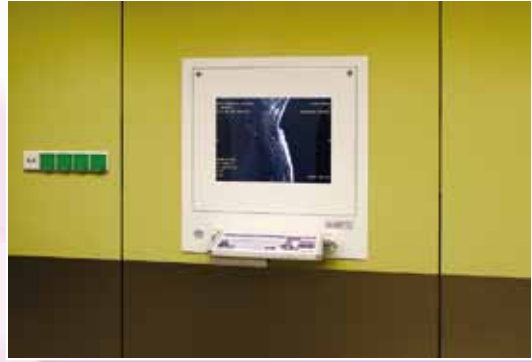
DiCO 1M (21")