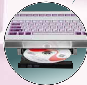
Zewnętrzna stacja CD/DVD dla wersji do zabudowy