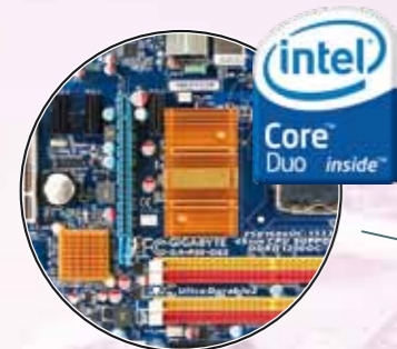
Wysokiej klasy system komputerowy (gwarantujący najwyższą niezawodność i wydajność)

Wysokiej klasy monitory medyczne EIZO o przekątnej ekranu min. 21" i rozdzielczości min. 2 MP, zgodne z DICOM-CL. Opcjonalnie monitory o większych przekątnych ekranu (24"; 30"; 40"; 47"; 56")