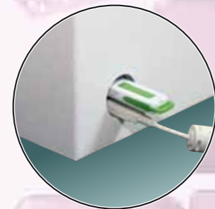
2 gniazda USB zabezpieczone przed zalaniem