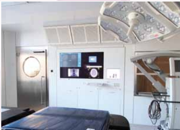
DiCO 2M (56"/17")