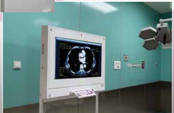
DiCO 1M (47")