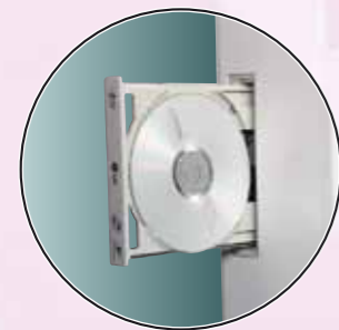
Zintegrowana stacja CD/DVD

dla bloków operacyjnych, klinik, oddziałów szpitalnych, przychodni itp.