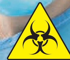
Oznaczenie ostrzegawcze o materiałach zakaźnych