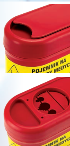
Pokrywa wrzutowa pojemnika