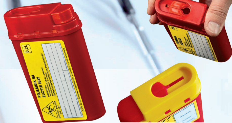
Mechanizm wrzutowy pojemnika na igły