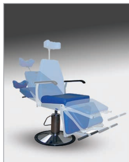
płynna regulacja oparcia pleców, oraz podnóżka