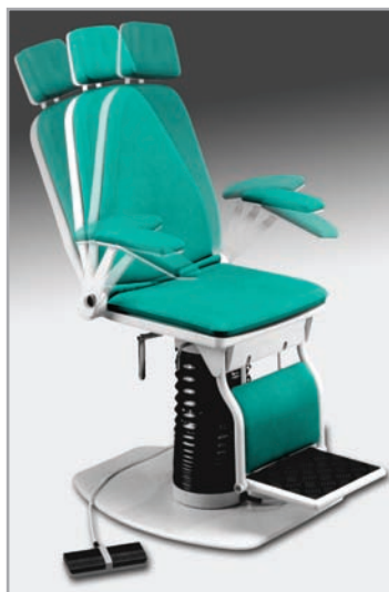
płynna regulacja oparcia pleców, odchylane podłokietniki