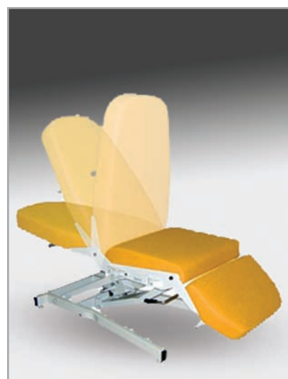
niezależnie regulowane sekcje fotela