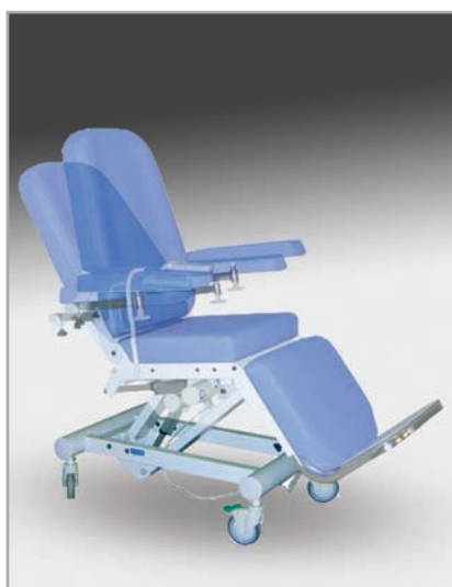
płynna regulacja oparcia pleców, odchylane podłokietniki