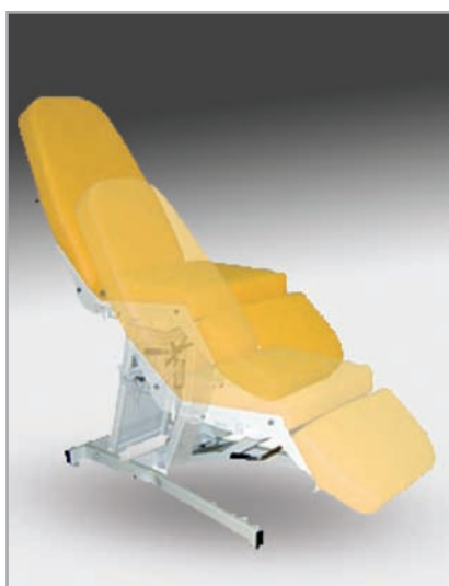
płynnie regulowana wysokość fotela

Wersja z stałą wysokością: Cena od 1 800,00 €