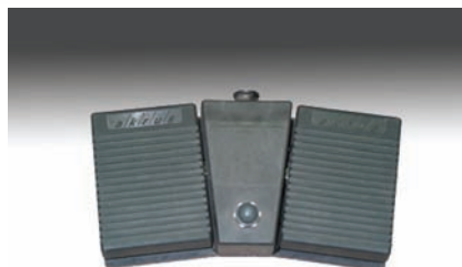
panel nożny do sterowania pracą stołu (opcja)