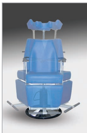
obrót fotela o 360° stopni z możliwością blokady położenia