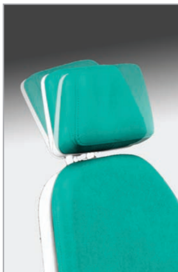
podglówek z płynnie regulowanym kątem odchylenia