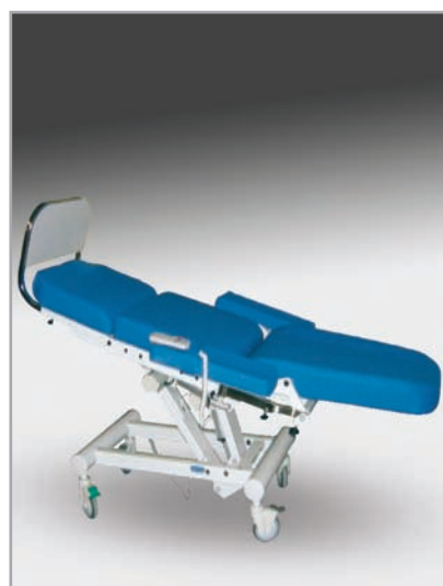
pozycja anty trendelenburga i trendelenburga