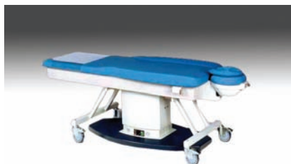
system do przemieszczania stołu (opcja)