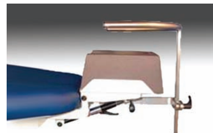
dodatkowy podpora rąk dla operatora (opcja)

Prosty stół okulistyczny w zakresie operacji laserowych oka i nie tylko. Standardowo dostępna wersja ze stałą wysokością leża. Stół posiada wiele bardzo funkcjonalnych rozwiązań, stwarza profesjonalne stanowisko pracy dla lekarza i komfortowe warunki dla pacjenta. Opcjonalnie stół posiada możliwość elektrycznej regulacji wysokości w zakresie 200 mm. Podgłówek regulowany ręcznie w zakresie od +15° do -25°.