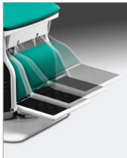
podnóżek z możliwością płynnej regulacji wysokości