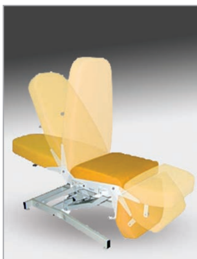
płynna regulacja oparcia pleców oraz podnóżka