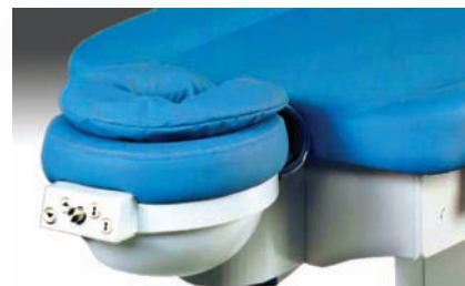
dodatkowy podgłówek powietrzny (opcja)

Stół okulistyczny LS to nowy standard w zakresie operacji laserowych oka. Został zaprojektowany we współpracy z chirurgami i specjalistami systemów laserowych. Stół posiada wiele bardzo funkcjonalnych rozwiązań, stwarza profesjonalne stanowisko pracy dla lekarza i komfortowe warunki dla pacjenta.