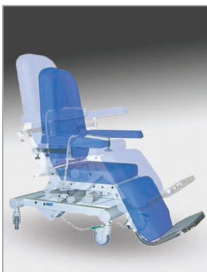
płynnie regulowana wysokość fotela oraz regulowany podnóżek