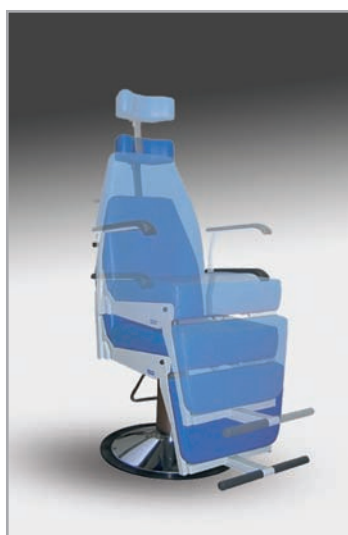
płynnie regulowana wysokość fotela