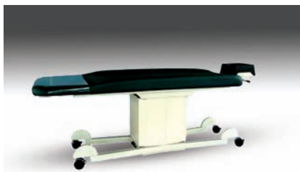
podstawa jedna z dodatkowymi kołami do łatwiejszego przemieszczania stołu (opcja)