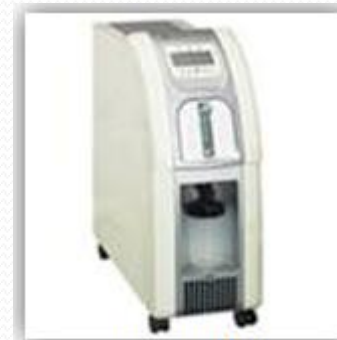
cena netto 3000 USD

Yellow cells are marked the part of main difference point.