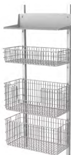
Regał RKS-2 z wyposażeniem