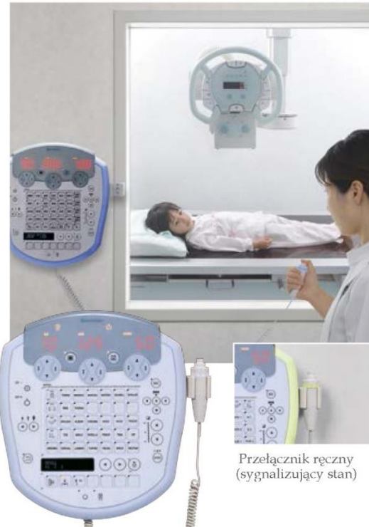
Przełącznik ręczny (sygnalizujący stan)