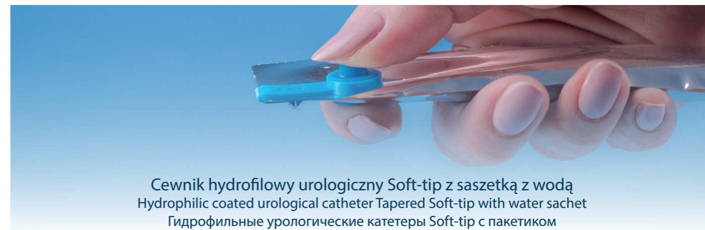
Cewnik hydrofilowy urologiczny Soft-tip z saszetką z wodą Hydrophilic coated urological catheter Tapered Soft-tip with water sachet Гидрофильные урологические катетеры Soft-tip с пакетиком