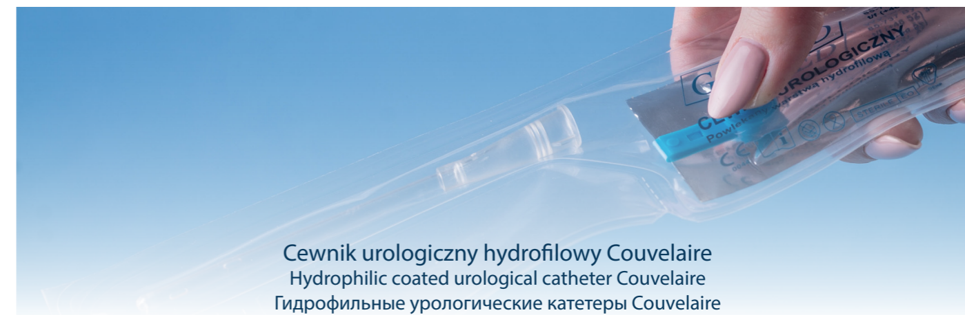
Cewnik urologiczny hydrofilowy Couvelaire Hydrophilic coated urological catheter Couvelaire Гидрофильные урологические катетеры Couvelaire