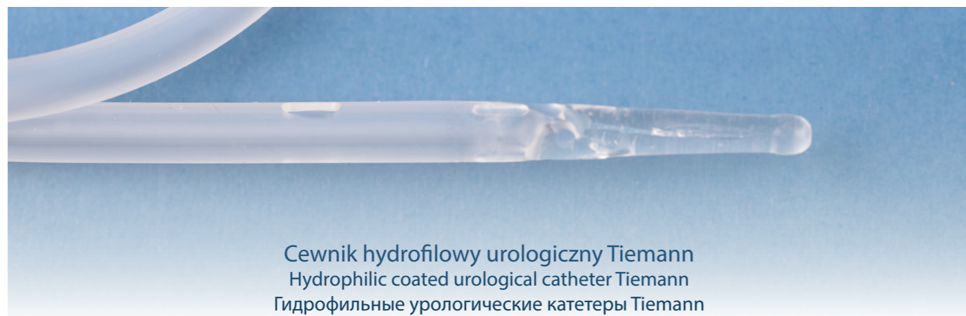
Cewnik hydrofilowy urologiczny Tiemann Hydrophilic coated urological catheter Tiemann Гидрофильные урологические катетеры Tiemann