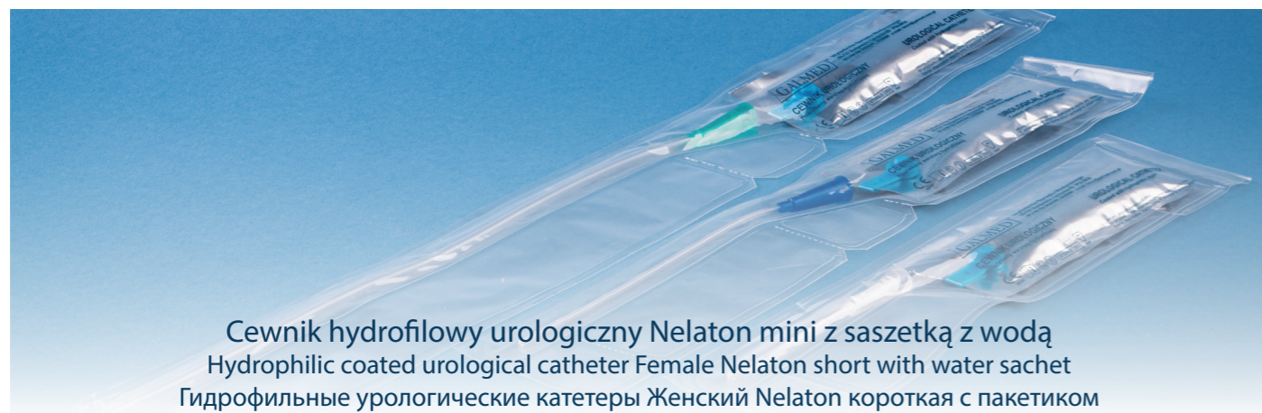
Cewnik hydrofilowy urologiczny Nelaton mini z saszetką z wodą Hydrophilic coated urological catheter Female Nelaton short with water sachet Гидрофильные урологические катетеры Женский Nelaton короткая с пакетиком