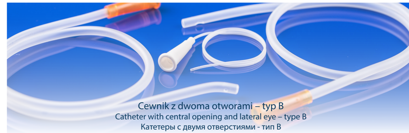
Cewnik z dwoma otworami – typ B Catheter with central opening and lateral eye – type B Катетеры с двумя отверстиями - тип B