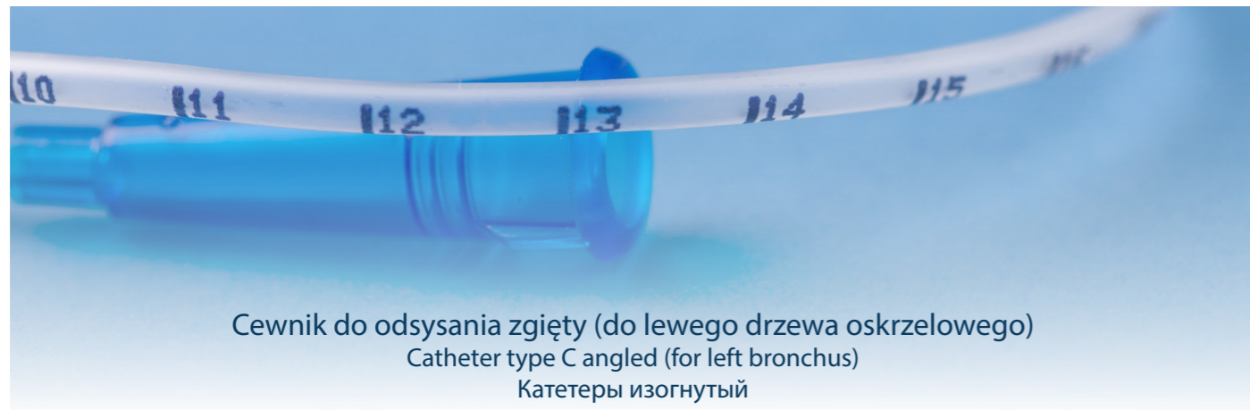
Cewnik do odsysania zgięty (do lewego drzewa oskrzelowego) Catheter type C angled (for left bronchus) Катетеры изогнутый