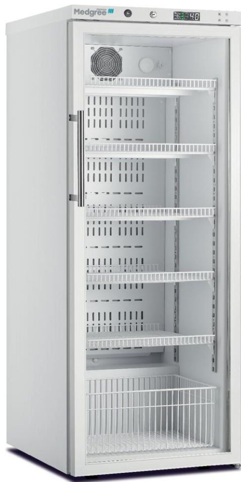
MPRA 350 G