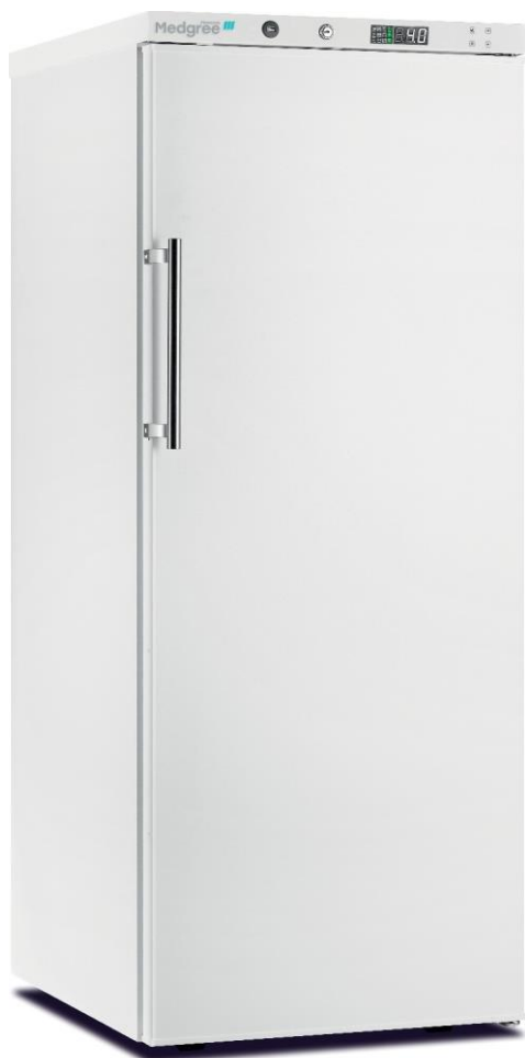
MPRA 350 S