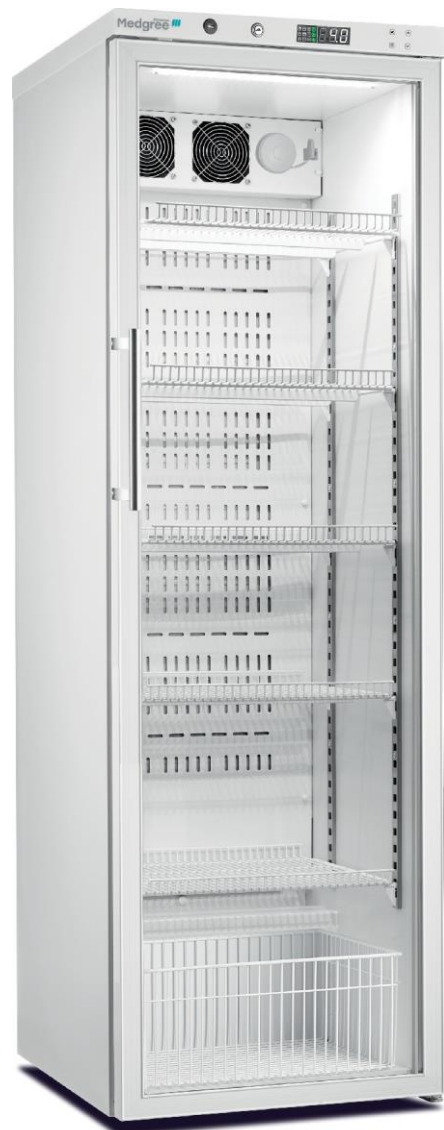
MPRA 450 G