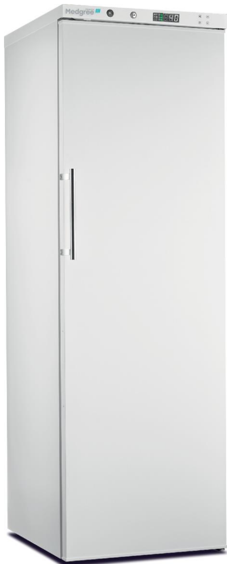
MPRA 450 S