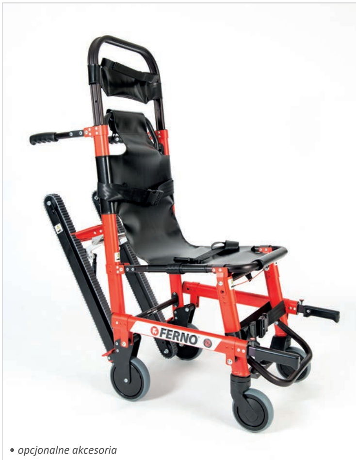
• opcjonalne akcesoria